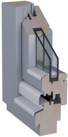
Abb. 1: Holzfenster mit 2fach-Verglasung