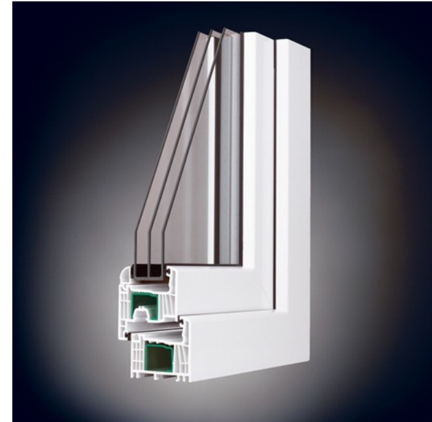
Abb. 3: Kunststoff – Fenster mit 3fach-Verglasung

Link: http://de.wikipedia.org/wiki/Fenster