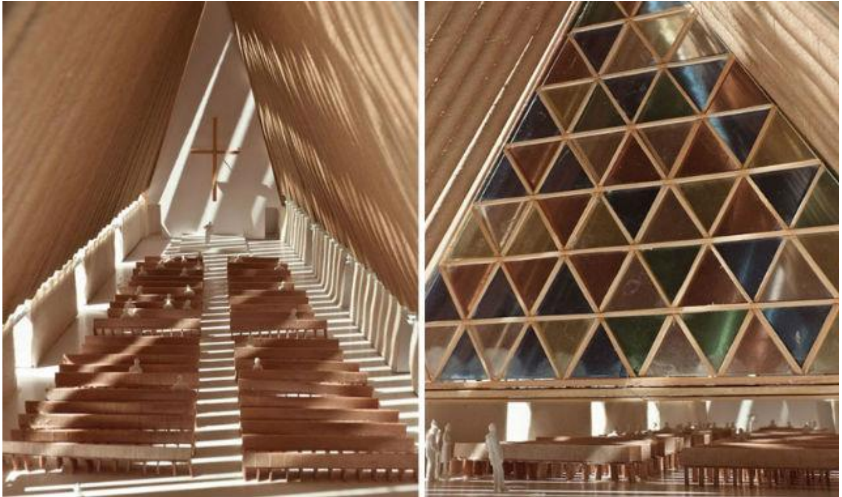
Die „Cardboard Cathedral“ - eine temporäre Kirche von Shigeru Ban soll die durch ein Erdbeben zerstörte Kaathedrale der Stadt Christchurch vorerst ersetzen. | „Cardboard Cathedral“, Christchurch, Neuseeland | Shigeru Ban | 2012 http://www.baunetz.de/meldungen/Meldungen-Shigeru_Ban_baut_in_Neuseeland_2270527.html