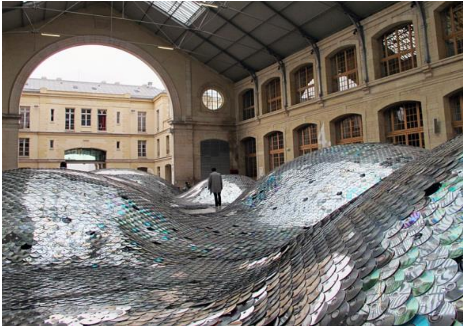
Die französische Künstlerin Élise Morin und der Architekt Clémence Eliard haben aus 65.000 alten CDs eine 500 m 2 große wellenförmige Landschaft gebaut, welche in der "Halle D'aubervilliers" in Paris zu finden ist. | Élise Morin und Clémence Eliard | Paris| 2011| http://elise-morin.com/Waste-Landscape-1 | WASTE LANDSCAPE 104 - YouTube