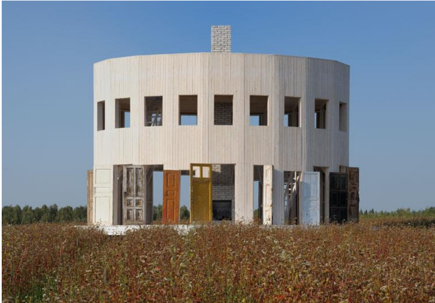
Für ein Sommerfestival baute Brodsky einen zweigeschossigen Holzpavillon auf elliptischem Grundriss. Die Türen stammen aus verlassenen Häusern der umliegenden Dörfer. | Rotunda I, Kaluga Region, 2009 | www.bauwelt.de/cms/artikel.html?id=3542537#.U0rZpLHwDL8 | BAUWELT 29.2011