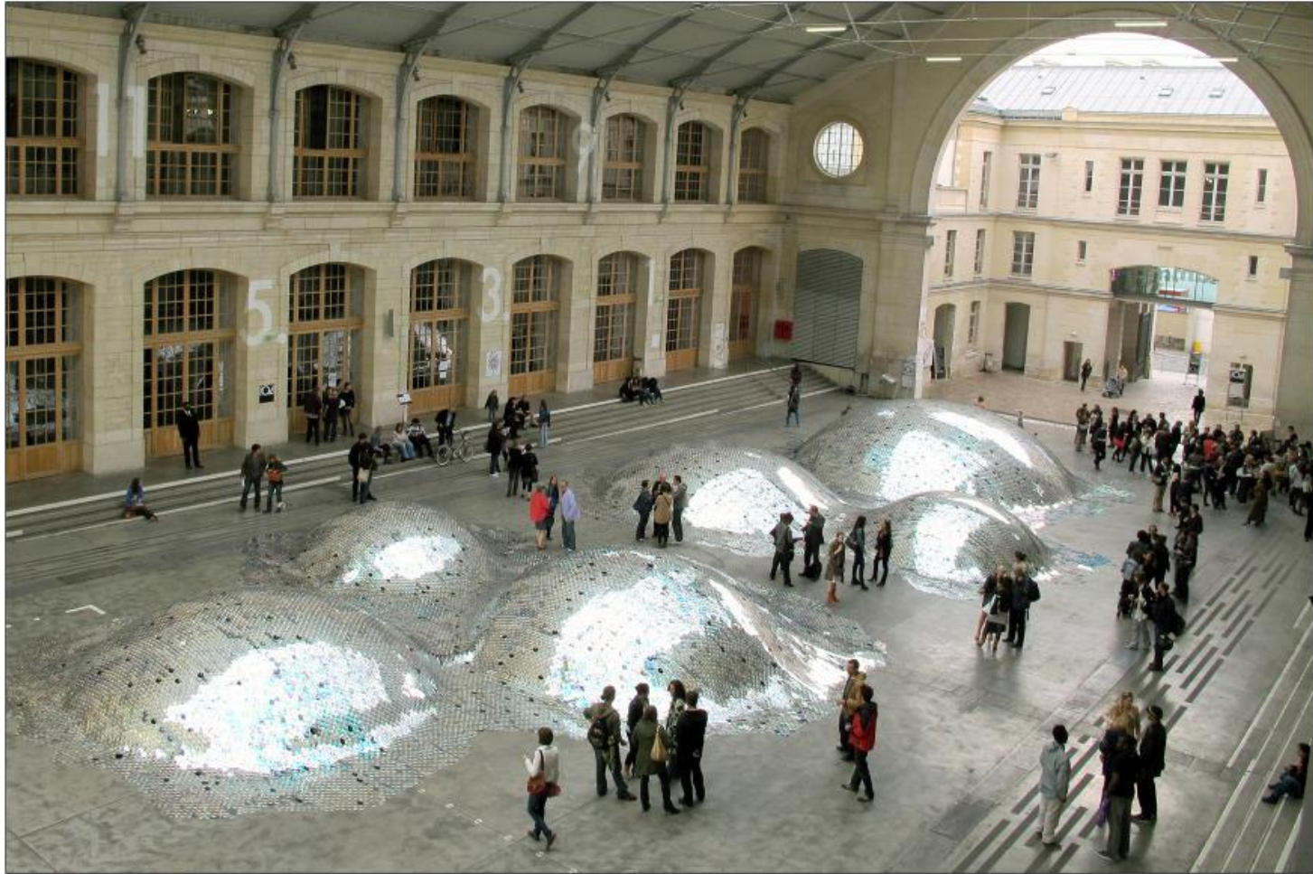
Die französische Künstlerin Élise Morin und der Architekt Clémence Eliard haben aus 65.000 alten CDs eine 500 m 2 große wellenförmige Landschaft gebaut, welche in der "Halle D'aubervilliers" in Paris zu finden ist. | Élise Morin und Clémence Eliard | Paris| 2011| http://elise-morin.com/Waste-Landscape-1 | WASTE LANDSCAPE 104 - YouTube