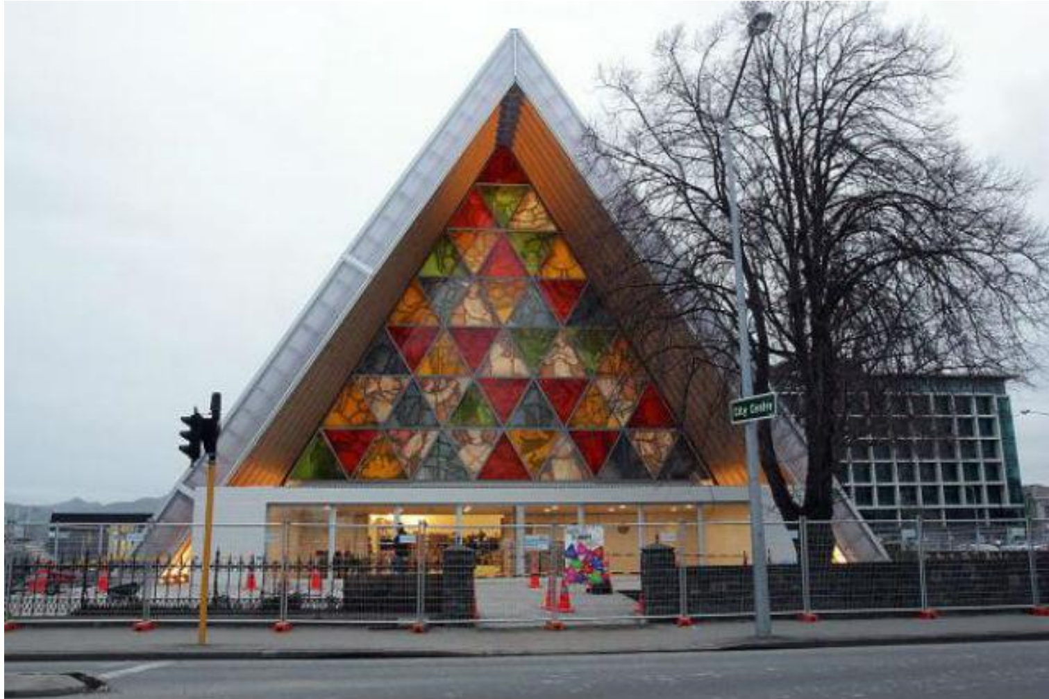
Die „Cardboard Cathedral“ - eine temporäre Kirche von Shigeru Ban soll die durch ein Erdbeben zerstörte Kathedrale der Stadt Christchurch vorerst ersetzen. | „Cardboard Cathedral“, Christchurch, Neuseeland | Shigeru Ban | 2012 http://www.baunetz.de/meldungen/Meldungen-Shigeru_Ban_baut_in_Neuseeland_2270527.html