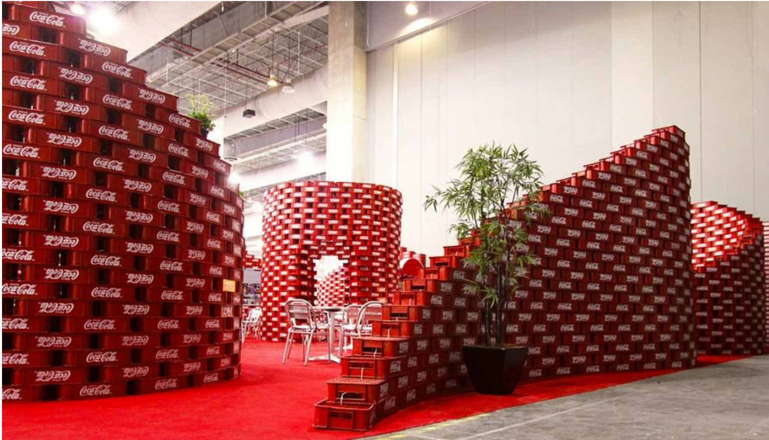
Social Topography - Upcycling Pavilion | BNKR Arquitectura | , Mexico City, Mexico | 2012 http://www.e-architect.co.uk/architects/bnkr-arquitectura