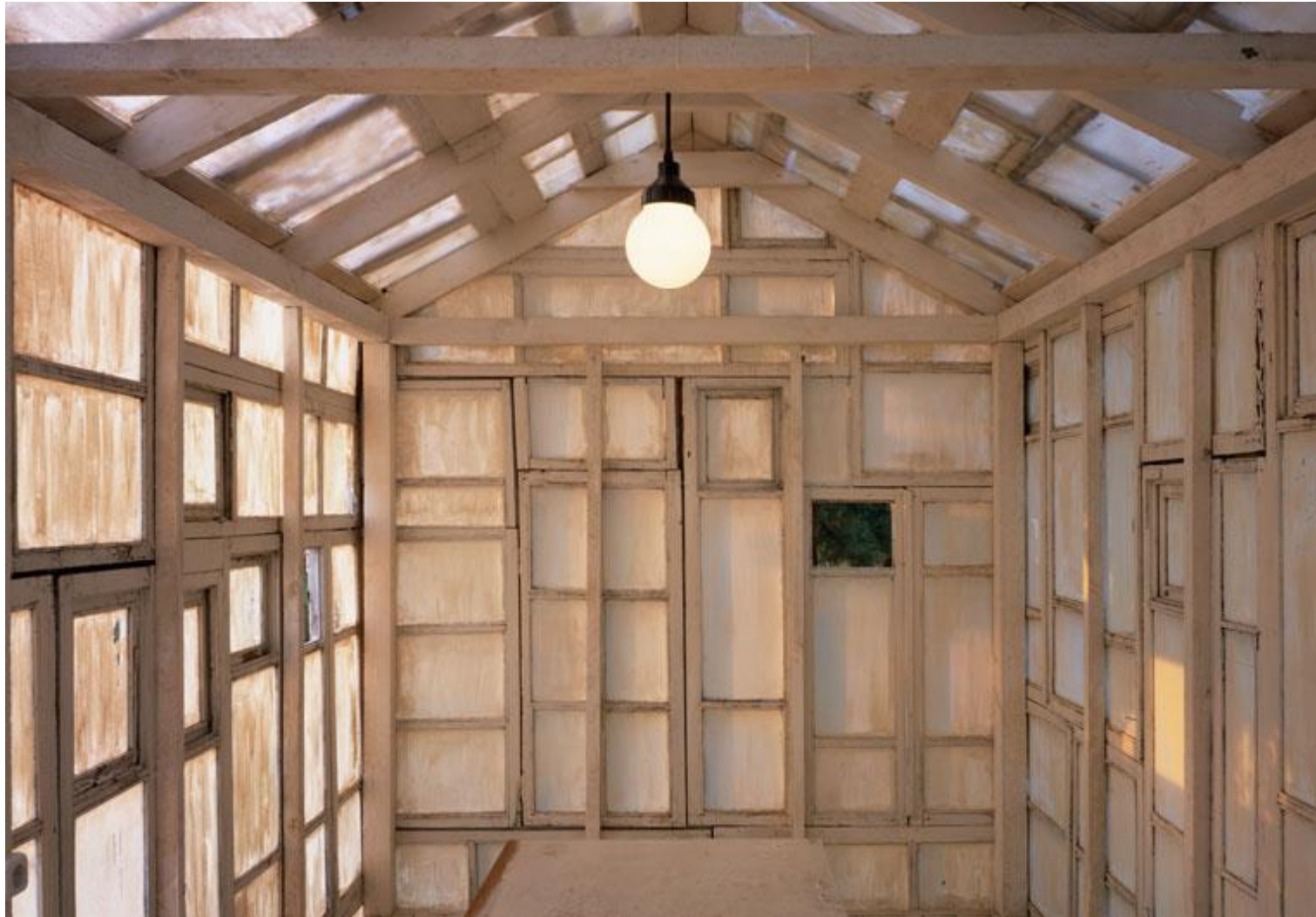
Den Pavillon für Wodka-Zeremonien baute Brodsky aus den alten Fenstern einer ehemaligen Textilfabrik. | Pavillon für Wodka Zeremonien, 2003, Klayzminskoe Reservoir, Moskau-Umgebung, Alexander Brodsky | www.bauwelt.de/cms/artikel.html?id=3542537#.U0rZpLHwDL8 | BAUWELT 29.2011