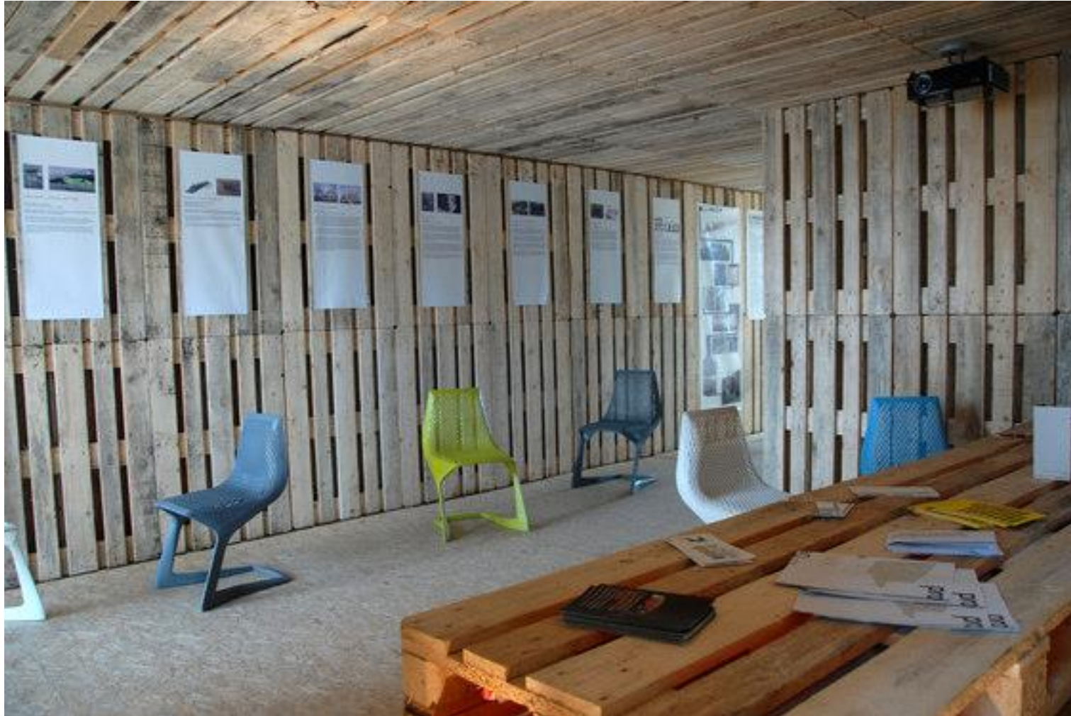
Das Palettenhaus - Entworfen wurde das Palettenhaus 2007 im Rahmen der European student competition on sustainable architecture gau:di. | „Cardboard Cathedral“, Christchurch, Neuseeland | Designteam: Andreas Claus Schnetzer, Gregor Pils |2007 http://www.architonic.com/de/aisht/palettenhaus-sparch/5101057