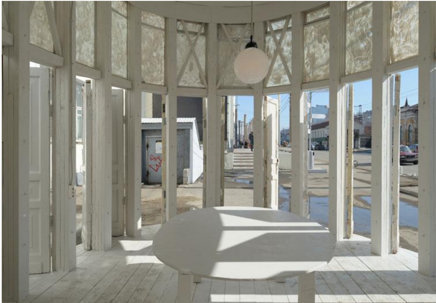
Für ein Sommerfestival baute Brodsky einen zweigeschossigen Holzpavillon auf elliptischem Grundriss. Die Türen stammen aus verlassenen Häusern der umliegenden Dörfer. | Rotunda I, Kaluga Region, 2009 | www.bauwelt.de/cms/artikel.html?id=3542537#.U0rZpLHwDL& | BAUWELT 29.2011