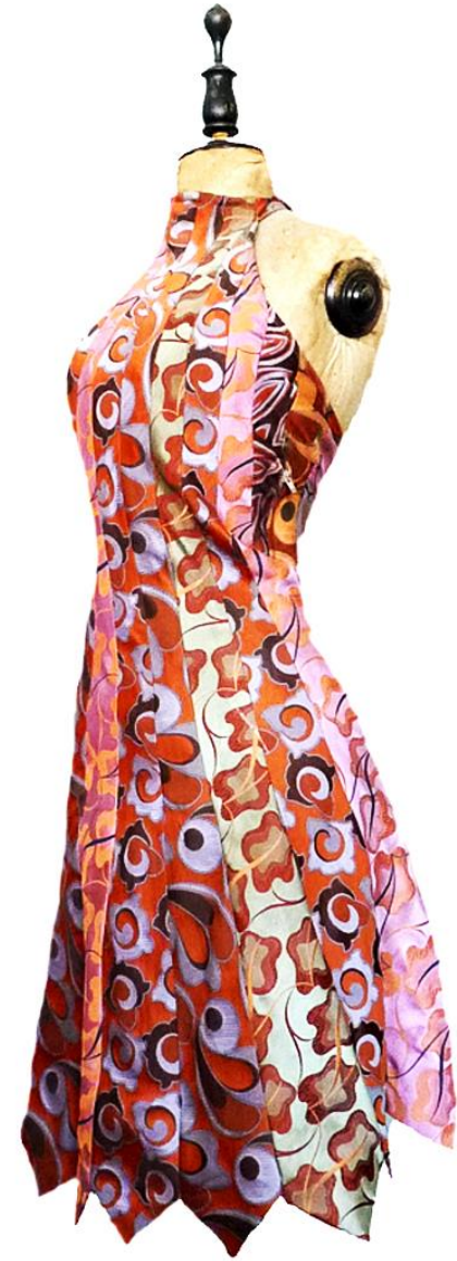
Hemdschürzen| Krawattenkleider | http://cs-sc.elektroflux.net/?page_id=28