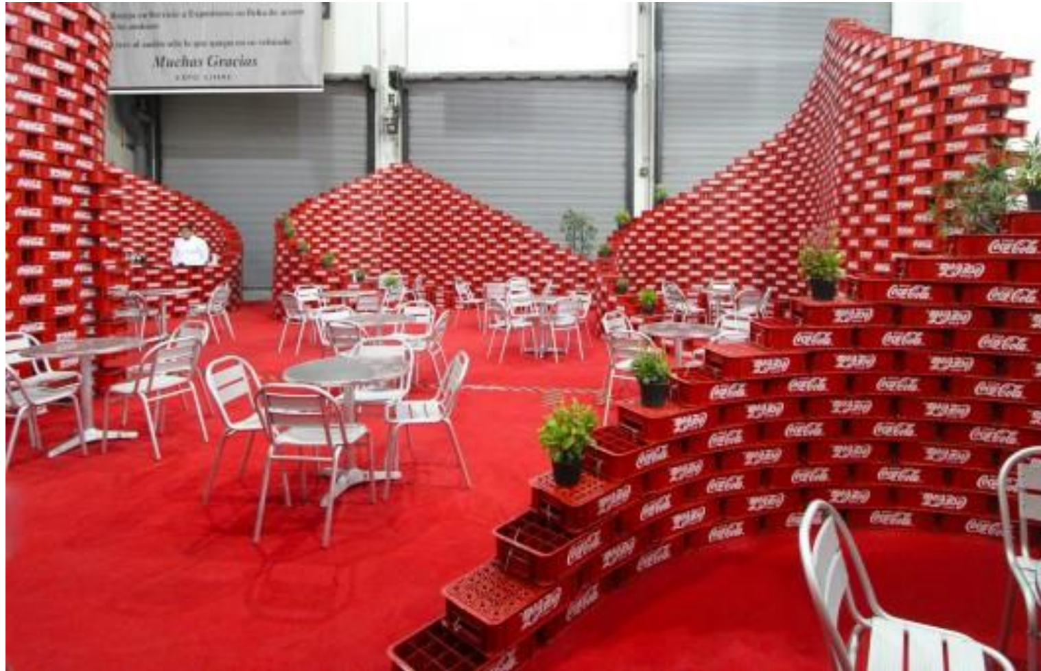
Social Topography - Upcycling Pavilion | BNKR Arquitectura | , Mexico City, Mexico | 2012 http://www.e-architect.co.uk/architects/bnkr-arquitectura