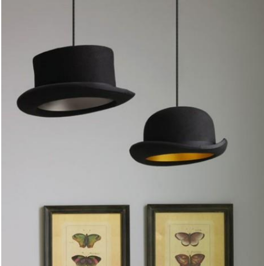
Pan Tau an der Decke http://www.andersdenken.at/upcycling-kreativitaetstraining/