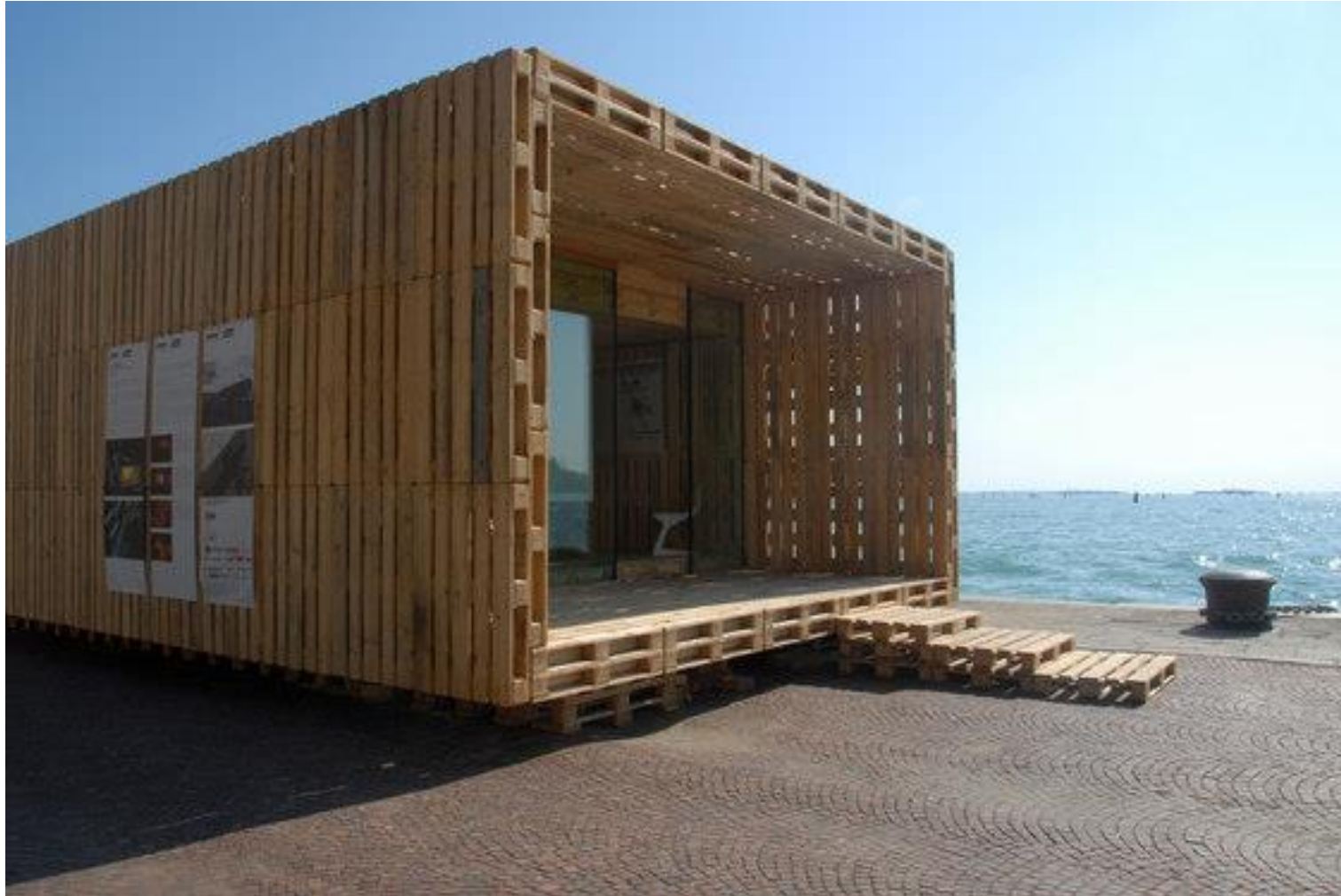
Das Palettenhaus - Entworfen wurde das Palettenhaus 2007 im Rahmen der European student competition on sustainable architecture gau:di. | „Cardboard Cathedral“, Christchurch, Neuseeland | Designteam: Andreas Claus Schnetzer, Gregor Pils |2007 http://www.architonic.com/de/aisht/palettenhaus-sparch/5101057