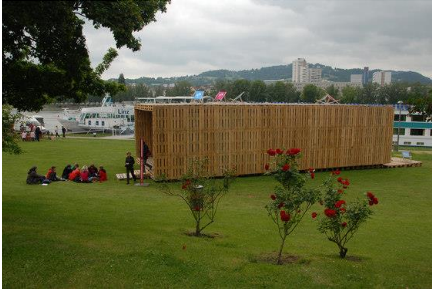
Das Palettenhaus - Entworfen wurde das Palettenhaus 2007 im Rahmen der European student competition on sustainable architecture gau:di. | „Cardboard Cathedral“, Christchurch, Neuseeland | Designteam: Andreas Claus Schnetzer, Gregor Pils | 2007 http://www.architonic.com/de/aisht/palettenhaus-sparch/5101057