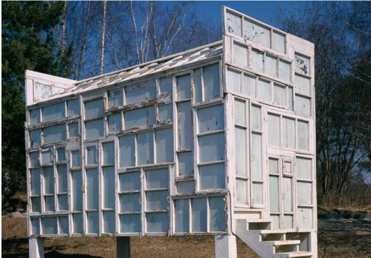
Den Pavillon für Wodka-Zeremonien baute Brodsky aus den alten Fenstern einer ehemaligen Textilfabrik. | Pavillon für Wodka Zeremonien, 2003, Klayzminskoe Reservoir, Moskau-Umgebung, Alexander Brodsky | www.bauwelt.de/cms/artikel.html?id=3542537#.U0rZpLHwDL8 | BAUWELT 29.2011