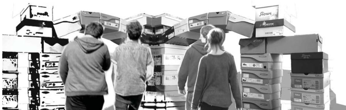
Abbildung 1, Fantasie-Triumphbogen

Versucht mit mind. ca. 50 Schuhschachteln einen echten Bogen über Pfeilern zu bauen, mit weiteren seitlichen Pfeilern und Abstreberungen zu den Haupt-Pfeilern; wie im Querschnitt einer gotischen Kathedrale oder baut einen Triumphbogen ganz nach eurer Fantasie.