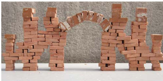
Abbildung 2, Modell zeigt das Prinzip vom Querschnitt einer frühgotischen Kathedrale

Vor dem Baubeginn zählt ab, wieviele Schachteln ihr zur Verfügung habt. Dann könnt ihr überlegen, wie der Bogenbau ungefähr aussuchen könnte. Als Orientierungshilfe gibt es am Ende eine Seite mit Vorlagen. Für die Auflager des Bogens und der Strebwerke braucht ihr ein paar breitere Schachteln, welche ihr vorher zur Seite legen solltet. Zusätzlich müsst ihr überlegen welche Schachteln mit gewichtigen Inhalt versehen werden können und diese auch für den Abschluss zurücklegen. Um es ein wenig zu erleichtern, wäre auch noch gut die Schachteln für den Bogen vorher auszusuchen. Am besten, solche die noch gut stabil sind und mit dem Deckel oben deutlich breiter als unten. Leicht beschädigte Schachteln, welche etwas aus der Form sind, könnt ihr mit gewichtigen Inhalt auf die Pfeiler ganz oben stellen.