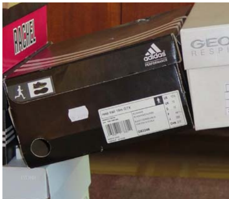
Abbildung 6, Klemmschiene für keilförmigen Zwischenraum

Die erste Schachtel des Bogens muss durch eine Distanz (=Ding 2x 4x25cm, z.B. Meterstab) in schräge Lage kommen-(siehe Abb.7)