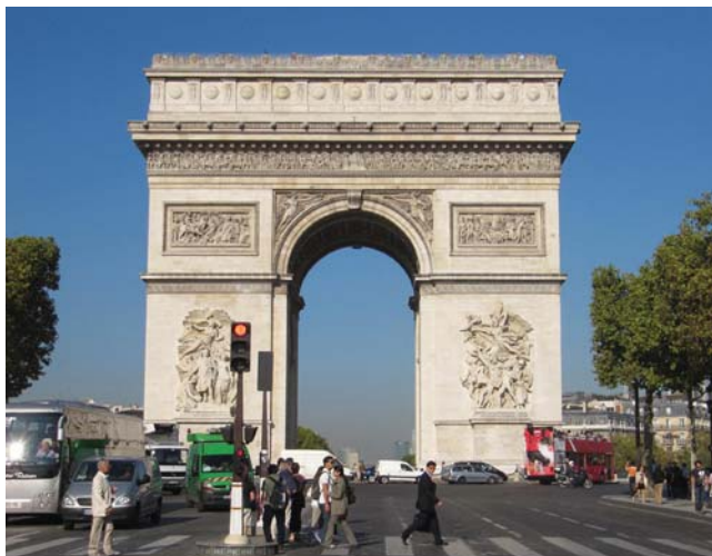
Abbildung 3, Triumphbogen, Paris