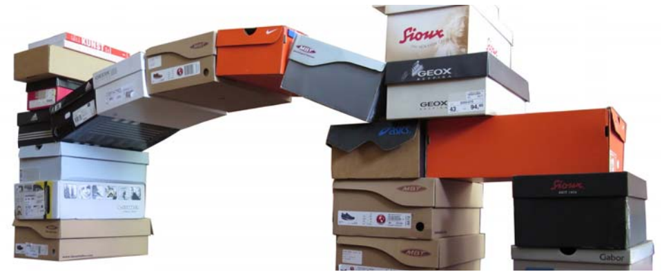
Abbildung 5, , oberer Teil "abgestrebter Pfeiler" mit Bogenansatz

Zuerst baut die Haupt- und Nebenpfeiler und auskragende seitliche Abstreben von den Nebenpfeilern zu den Hauptpfeilern (Kragbögen) und setzt Auflasten ganz oben drauf; z.B. Schachteln mit gewichtigen Inhalt. (siehe Abb.2, 4 und 5). Zunächst baut nur den 1. Hauptpfeiler. Vor Beginn des 2. Hauptpfeilers solltet ihr den eigentlichen Bogen am Boden auflegen um die Distanz zu erhalten. Also "gekippt" auflegen, dass die Schachteln mit der Vorderansicht nach oben liegen. Dann erst im richtigen Abstand den 2. Hauptpfeiler mit Strebewerk errichten, sodass wie in Abbildung 7 der fertige Bogen dann auch darüber reicht.