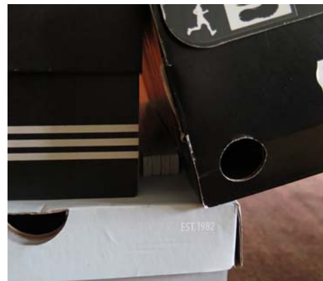
Abbildung 7, , Distanz für Schräglage