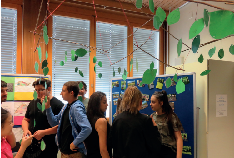
Abb. 9 Die Blätter des Mobiles spiegeln unsere Diskussionsinhalte rund um das Thema Landart

gut, Oasen im alltäglichen Sprachgebrauch. Gemeinsam mit der 4b Klasse und meiner Kollegin Kim Strauß haben wir uns auf die Suche nach Sprach-oasen gemacht und diese zum Pflücken für jedermann, jedefrau und jedeskind an einer Wäscheleine aufgehängt. Am Ende der Projektpräsentation sind viele Metaphern und Zitate tatsächlich in den Taschen der Besucher/innen verschwunden. Gemma BILLA! versus sich den verbotenen Früchten hingeben ... – als Lesezeichen vielleicht...?